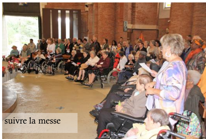
suivre la messe