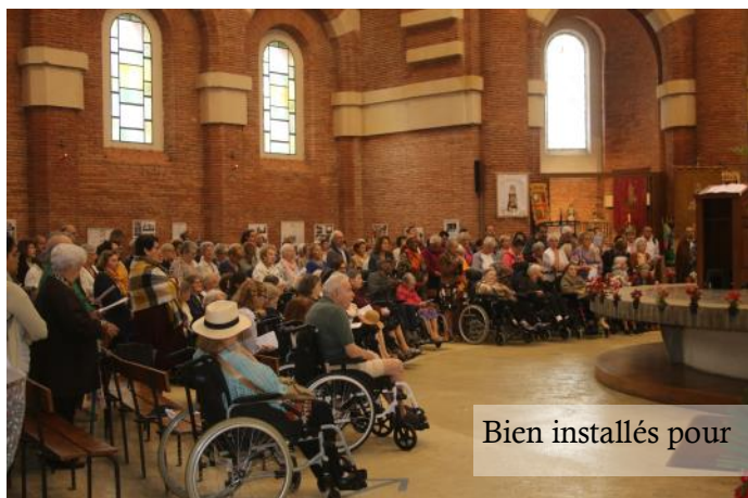
Bien installés pour

Le 15 juin, la basilique Sainte-Germaine a accueilli des résidents de plusieurs maisons de retraites qui ont passé la journée à Pibrac en participant à de nombreuses manifestations et cérémonies : la messe, le repas partagé et le chemin de croix.